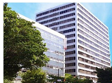
TKPガーデンシティ天神

■ 会 場 TKPガーデンシティ天神 福岡市中央区天神2丁目14-8 福岡天神センタービル8F ■ 定 員 50名 (先着順) ■ 参加費 無料 ■ 締 切 平成28年10月25日(火) ※裏面FAX用紙にてお申込下さい